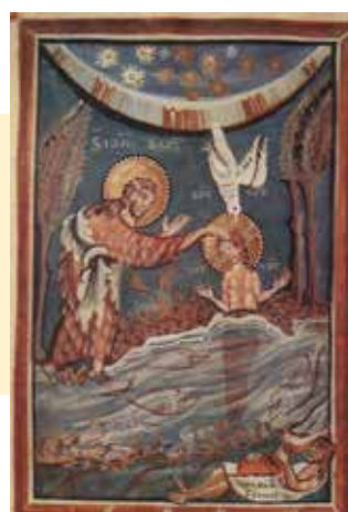
Taufe Christi, Miniatur aus dem Hitda-Evangeliar, um 1020

Die Botschaft von Weihnachten bezieht sich nicht nur auf das neugeborene Kind in der Krippe, sondern klingt auch noch in der Taufe des erwachsenen Jesus im Jordan an. Die Tagzeitenliturgie an Epiphanie zählt die Taufe Jesu zu den „drei Wundern“ des Kommens Gottes: „Heute führte der Stern die Weisen zum Kind in der Krippe. Heute wurde Wasser zu Wein in der Hochzeit. Heute wurde Christus im Jordan getauft, uns zum Heile“ (Magnificat-Antiphon). JOSEF-ANTON WILLA AUF LITURGIE.CH