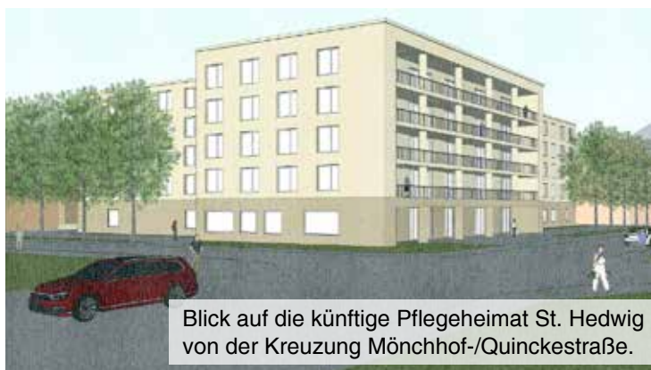
Blick auf die künftige Pflegeheimat St. Hedwig von der Kreuzung Mönchhof-/Quinckestraße.

Für die Zeit bis zum Umzug und insbesondere die letzte Februarwoche sucht die Pflegeheimat St. Hedwig ehrenamtliche Helferinnen und Helfer! Gesucht werden engagierte Menschen, die 57 Bewohnerinnen und Bewohner auf dieses einschneidende Ereignis mit vorbe-