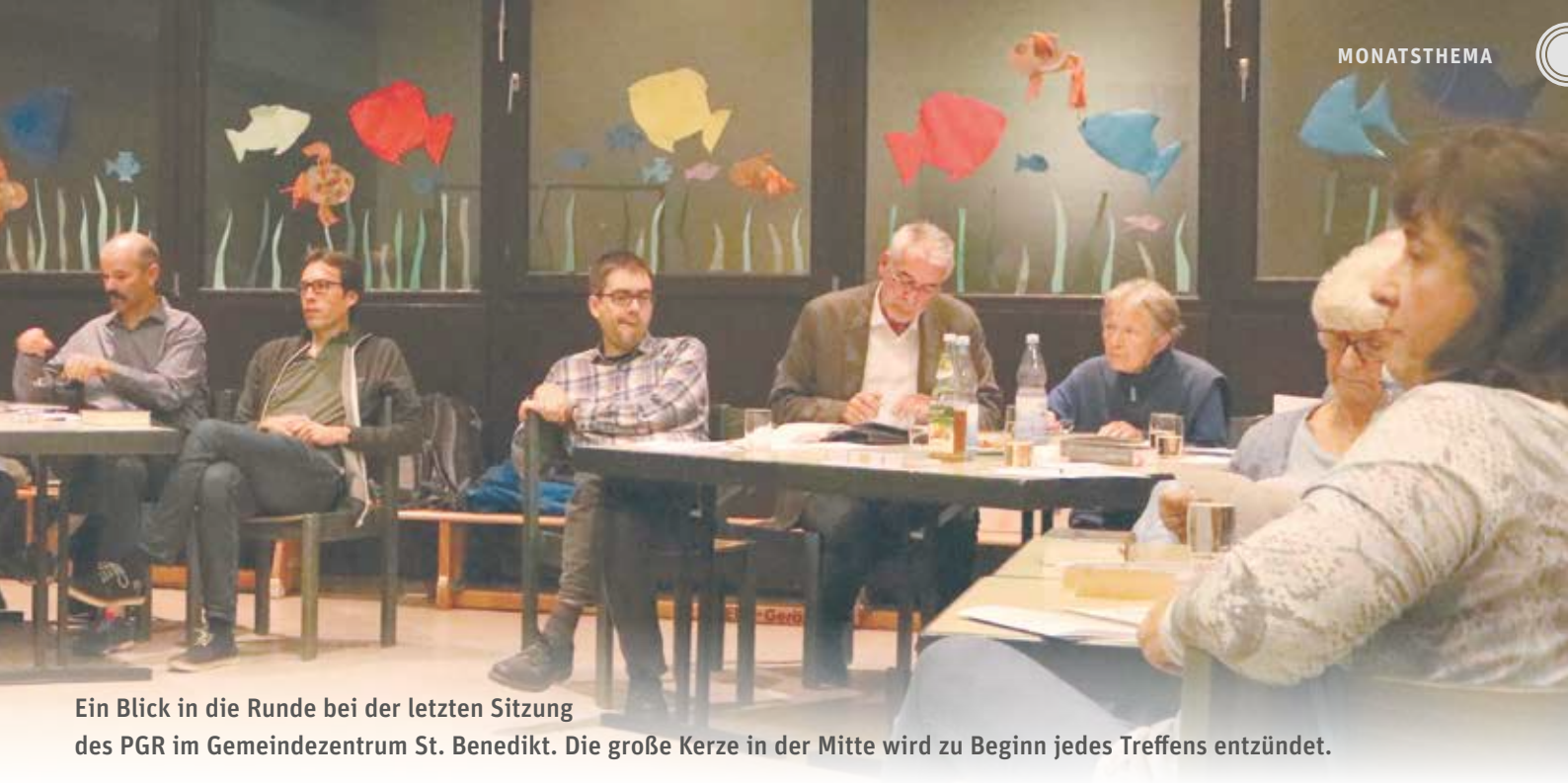
Ein Blick in die Runde bei der letzten Sitzung des PGR im Gemeindezentrum St. Benedikt. Die große Kerze in der Mitte wird zu Beginn jedes Treffens entzündet.