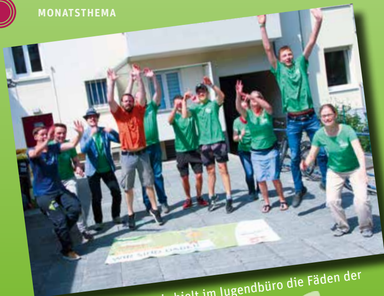
Der Koordinierungskreis hielt im Jugendbüro die Fäden der Aktion im ganzen Dekanat in der Hand.