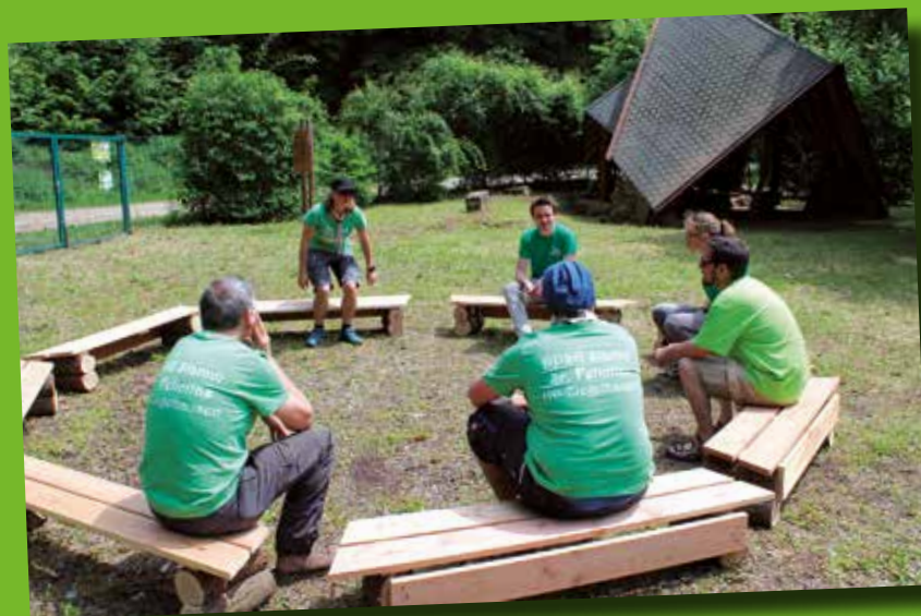
An der Walderlebnisanlage von „Natürlich Heidelberg“ kann man jetzt dank der Pfadfinder aus Ziegelhausen im Kreis sitzen.