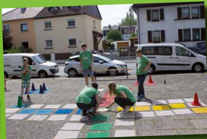
In Eppelheim konnte XXL-Mensch ärgere dich nicht gespielt werden.