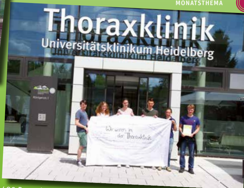
400 Rosen haben die Studierenden mit einem persönlichen Dank den Mitarbeiterinnen und Mitarbeitern der Thoraxklinik überbracht.