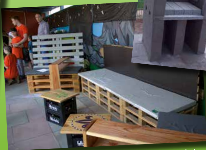
Einen Grill und Möbel für die Grillparty haben die Kirchheimer Pfadfinder gebaut.