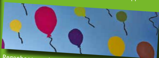
Regenbogen und Luftballons zieren dank der Jugendlichen aus Philipp Neri das St. Paulusheim.