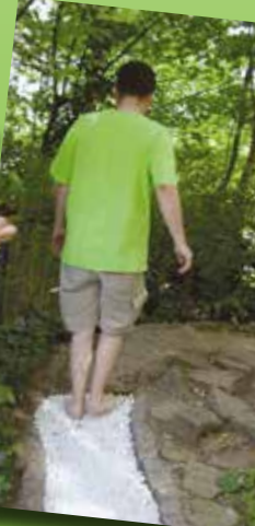
Hochbeete und einen Barfußpfad haben die Minis im Kindergarten St. Raphael entstehen lassen.