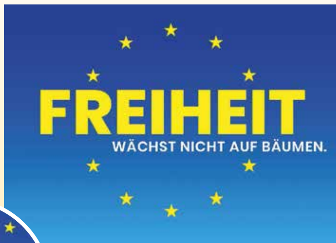
Postkartenmotive: Pulse of Europe