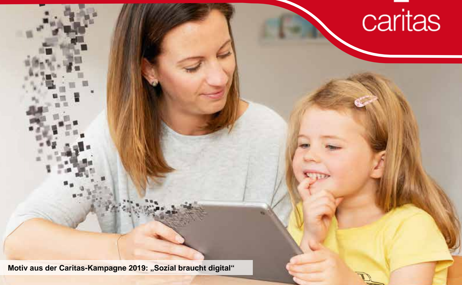
Motiv aus der Caritas-Kampagne 2019: „Sozial braucht digital“