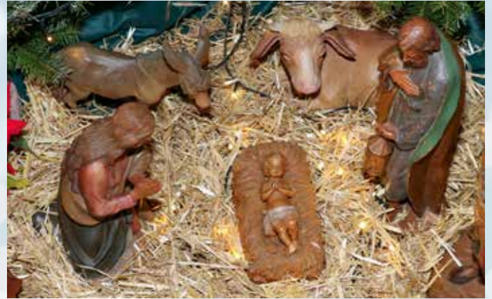
Das Titelbild zeigt die Krippe in der Kirche St. Bartholomäus in Wieblingen.