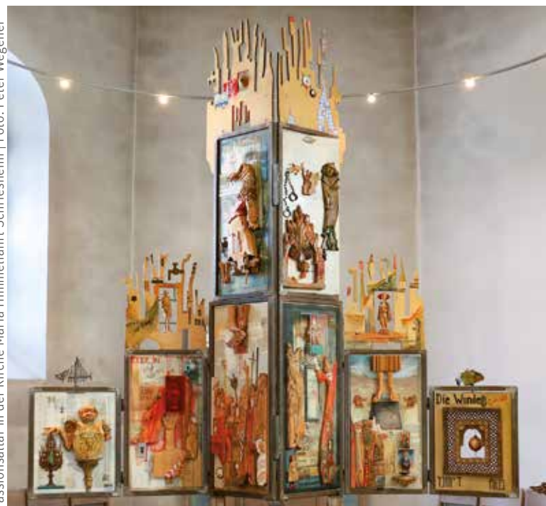
Passionsaltar in der Kirche Mariä Himmelfahrt Schriesheim