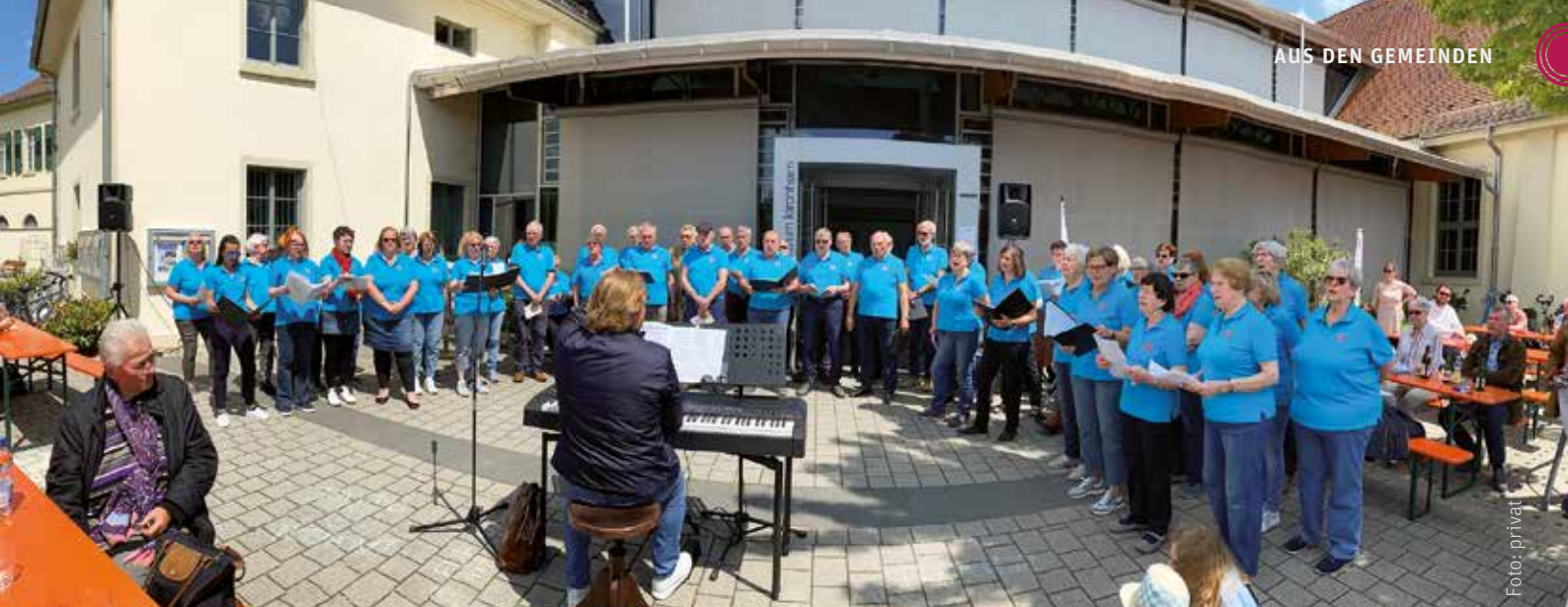
Heidelberger Lieder brachte die Chorgemeinschaft Eintracht-Sängerbund an Christi Himmelfahrt zu Gehör.