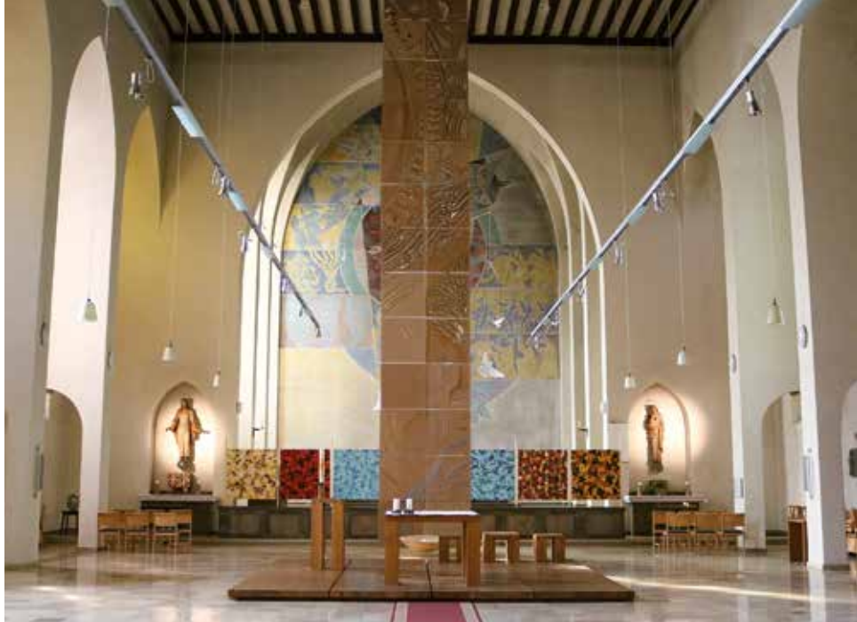
Kunstprojekt in St. Albert im Jahr 2016

Denn Armut – denken wir an unsere wohlhabende Stadt Heidelberg mit Eppelheim – ist auf den ersten Blick und aufs erste Hören nicht zu vermuten. Vielleicht an der ein oder anderen Stelle: da sitzt mal jemand in der Fußgängerzone, der um Geld bittet. So plural unsere Gesellschaft inzwischen ist, so vielschichtig ist Armut. Sie hat sich hineingeschlichen auch in die unteren Mittelstandsstrukturen. Die Corona-Krise, die Teuerung und die Energiepreisentwicklung wirken wie Katalysatoren. Es wird alles noch schneller sichtbar. Wenn man genau hinschaut, denn Armut steht oft nicht an vorderster Front, sie wird oft nicht bemerkt. Doch sie ist in ihrer Entfaltung fatal.