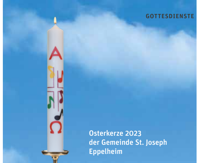
Osterkerze 2023 der Gemeinde St. Joseph Eppelheim