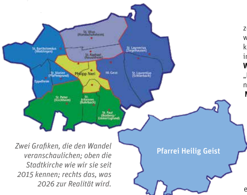
Zwei Grafiken, die den Wandel veranschaulichen; oben die Stadtkirche wie wir sie seit 2015 kennen; rechts das, was 2026 zur Realität wird.

Philipp Neri genannt. Schließlich ergab die Abstimmung ein eindeutiges Bild: Pfarrgemeinderat und Seelsorgeteam votierten einstimmig bei jeweils einer Gegenstimme für den Vorschlag Heilig Geist.