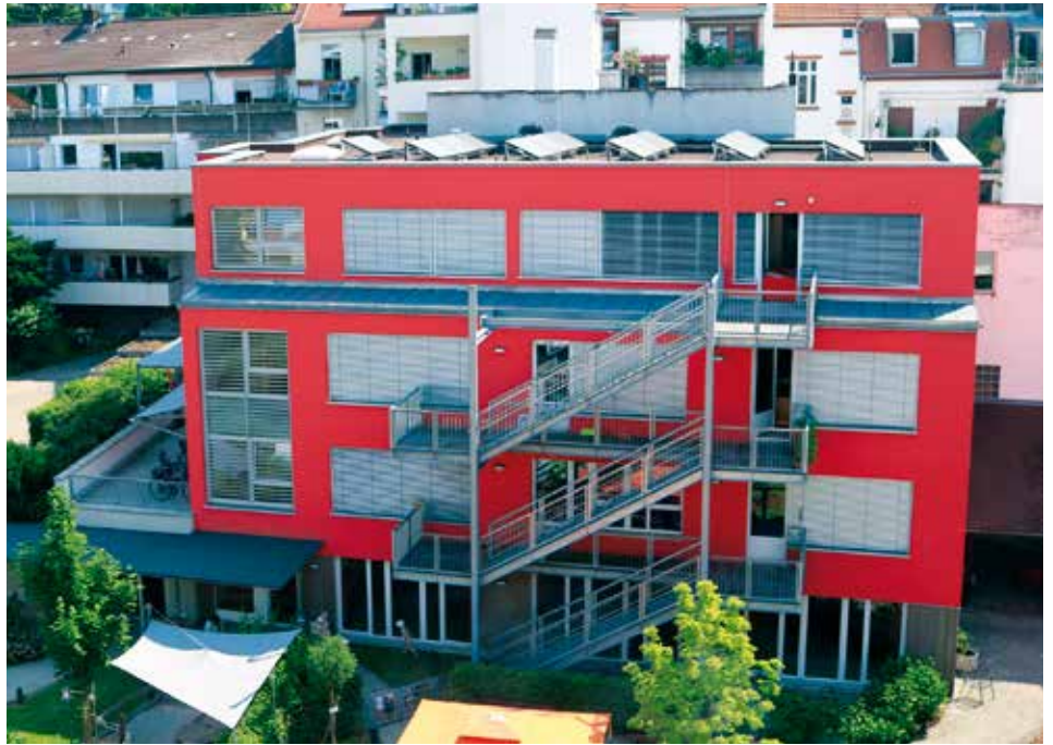
Wo früher ein Personalwohnheim des Altenpflegeheims St. Michael stand, wurde vor zehn Jahren das markante rote Gebäude für die Kinderkrippe errichtet.