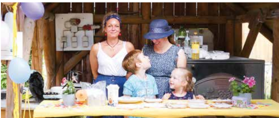
Impressionen vom Sommerfest der Kinderkrippe im Jubiläumsjahr