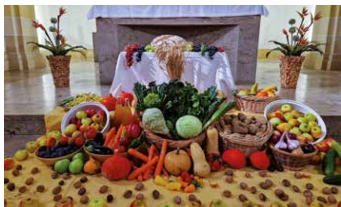
Erntedankaltar in der Kirche St. Peter

Chorprobe der PetersSingers: mittwochs, 19.15 Uhr, gr. Saal