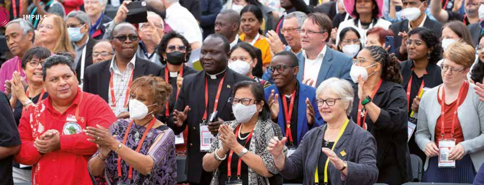
Gebetszeit der Delegierten bei der Vollversammlung des ÖRK in Karlsruhe