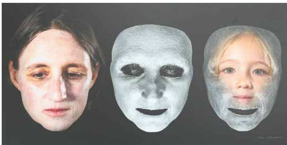
VOLKER HOFFESOMMER: Metamorphose, 2018