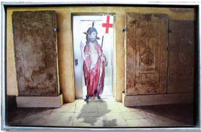
KLAUS GERLING: Der Aufzug im Leben, 2017