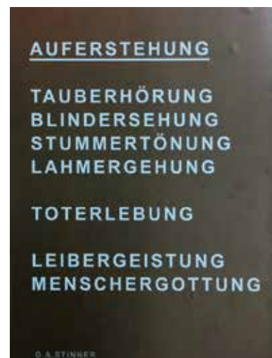
GEORG A. STINNES: Auferstehung, 2022

zurückfallen konnten. Nur so ist es möglich gewesen, dass die Osterbotschaft durch die Jahrhunderte nicht verstummt ist und jetzt in den hier ausgestellten Werken zum Ausdruck kommt. Eigentlich darf man sich von Gott kein Bild machen. Das sagt schon das zweite Gebot. Aber die Heilige Schrift und die sie begleitende Kunst zeigen immer wieder, dass es ohne Bilder nicht geht. Gott selbst hat sich nach dem Zeugnis der Schöpfungsgeschichte im Menschen ein Ebenbild erschaffen. Christus ist nach 2 Kor 4, 4 Gottes Bild. Wenn Gott überhaupt mit uns Menschen in Beziehung treten will, kann er das nur in Bildern. Jenseits der Bilder gibt es nur ein großes Nichtwissen, auf das der Mensch nur mit Schweigen antworten kann. Wer es allerdings versucht, weiß, wie schwer dieses Schweigen auszuhalten ist. Immer wieder fallen wir zurück in den Bereich der Bilder und Gleichnisse. Sowie wir den Mund auftun und versuchen, den Unbegreiflichen zu begreifen, befinden wir uns im Bereich