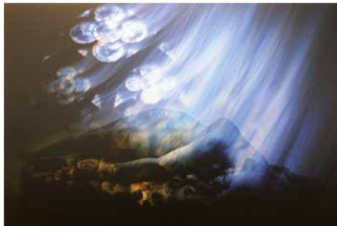
JULIA ASFOUR: Blaues Glück, 2021