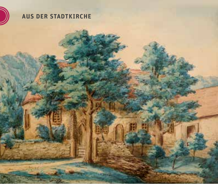
Aquarell von Philibert von Graimberg