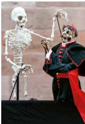
Foto: Marionettenoper im Säulensaal