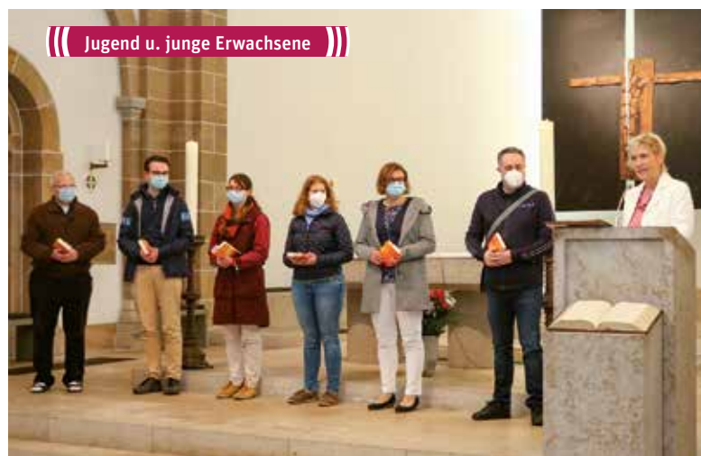
Jugend u. junge Erwachsene