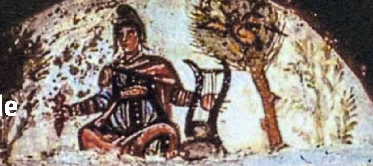
Jesus als Orpheus - frühchristl. Darstellung in der röm. Katakombe der hll. Petrus u. Priscilla