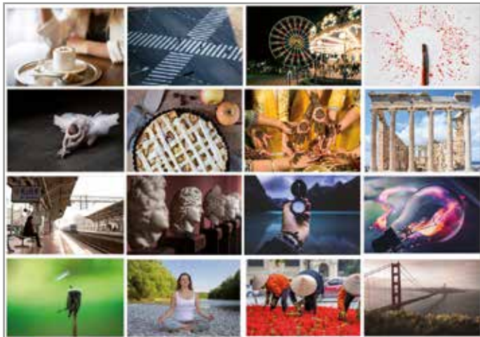
Bild auswählen und Eindrücke teilen

Der Phantasie sind dabei keine Grenzen gesetzt. Spielen Sie mehrere Runden. Es ist für alle interessant zu sehen, was die einzelnen jeweils in die Kamera halten.