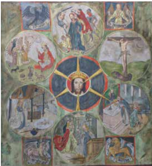
Meditationsbild des heiligen Bruders Klaus