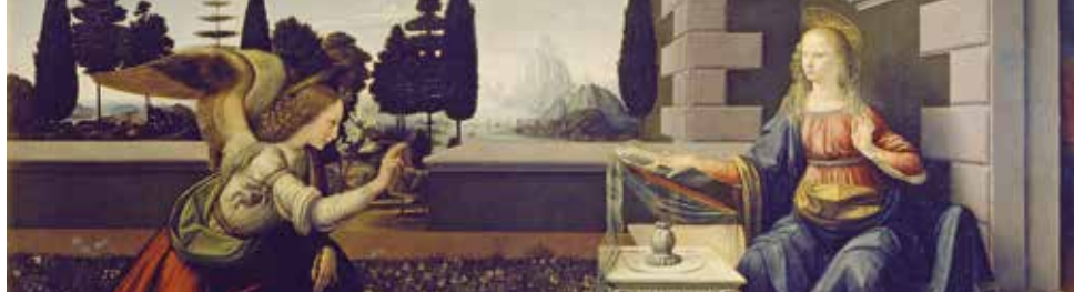
Leonardo da Vinci: Verkündigung (um 1472)

Der Engel des Herrn brachte Maria die Botschaft – und sie empfing vom heiligen Geist. Maria sprach: Siehe, ich bin die Magd des Herrn, mir geschehe nach deinem Wort.