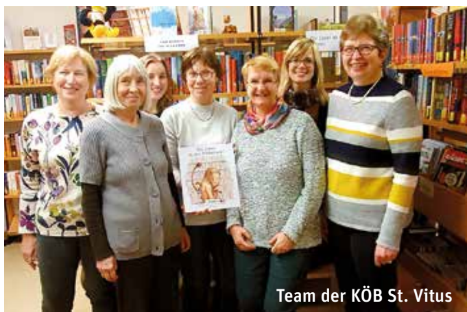
Team der KÖB St. Vitus

WWW.STADTKIRCHE-HEIDELBERG.DE/ENGAGEMENT