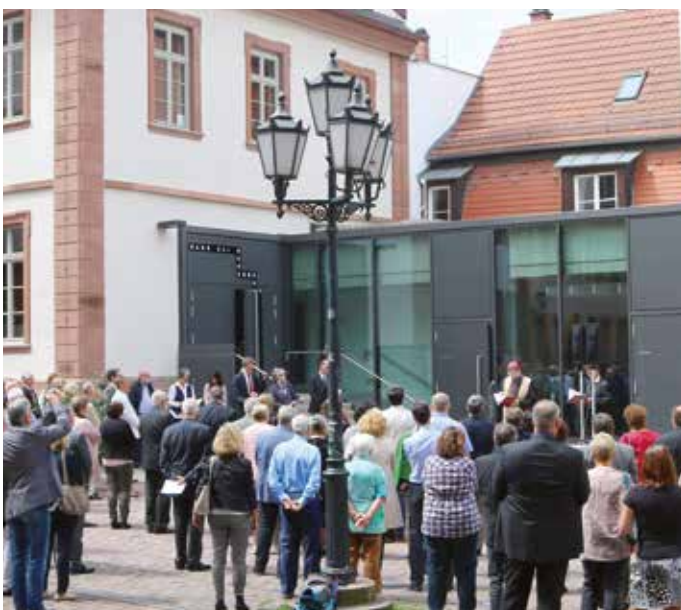
BILD Nach langjähriger Planung kann im März im Neuenheimer Feld der +punkt. eingeweiht werden und seine Arbeit aufnehmen. Mitträger des neuen ökumenischen Seelsorgezentrums der Heidelberger Klinik- und Hochschuleseelsorge ist die Stadtkirche.

Caritas ist 2016 ein großes Thema. Im Frühjahr nimmt sich der PGR einen Samstag Zeit, verschiedene Einrichtungen der Caritas zu besuchen und kennenzulernen. Im Herbst wird erstmals die Caritas-Sammlung gemeinsam in der Stadtkirche durchgeführt und ein stadtkirchenweiter Caritas-Sonntag in der Gemeinde St. Johannes gefeiert. Bei einem geistlichen Klausurwochenende im Kloster Jakobsberg verständigt sich der PGR auf grundlegende Ziele seiner Arbeit.