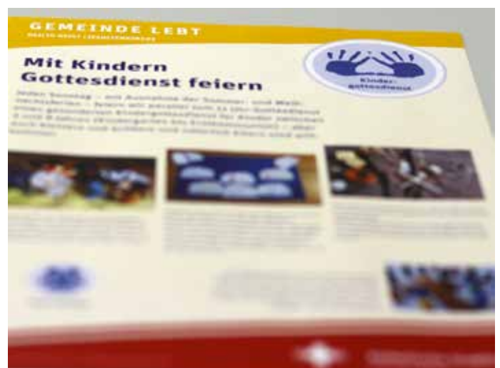
Die Ausstellung „Gemeinde lebt“ des Gemeindeteams Heilig Geist wird vom 9. Februar bis zum 6. März in der Jesuitenkirche zu sehen sein.

Vom 9. Februar bis 6. März wird in der Jesuitenkirche zu den Kirchenöffnungszeiten die Ausstellung „Gemeinde lebt!“ zu sehen sein. Es werden zwölf Plakate gezeigt, auf denen die Gruppen und Aktivitäten der Gemeinde Heilig Geist anschaulich dargestellt sind. Das Gemeindeteam möchte damit das aktive Gemeindeleben transparenter machen und würdigen sowie Kontakt zu den Verantwortlichen in den Gruppen ermöglichen.