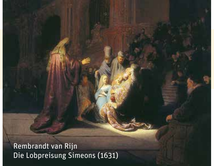
Rembrandt van Rijn Die Lobpreisung Simeons (1631)